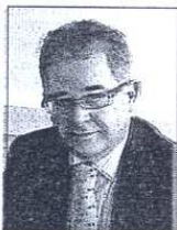
Άρθρο του Δρ. Κώστα Γ. Κόβας , ειδικού συνεργάτη Ατλαντίς Συμβουλευτική Α.Ε.

Εισηγούμαι λοιπόν στους επιχειρηματίες να αποβάλουν οποιονδήποτε πανικό και να εμπλακούν άμεσα σε μία διαδικασία αξιολόγησης των επιχειρηματικών τους δραστηριοτήτων. Το πρόβλημα σε πολλές περιπτώσεις δεν είναι πρόβλημα πόρων ή οικονομικό, αλλά πρόβλημα ποιότητας σκέψης. Η επιχείρηση που μπορεί να αξιοποιήσει στον μέγιστο βαθμό τις νοητικές της ικανότητες, και δεν εφαρμόζει απλά την πρώτη σκέψη και ιδέα που προκύπτει, δεν δέχεται τίποτα χωρίς να το αμφισβητεί επικριτικά, και δεν μιμείται και υιοθετεί μέτρα και δράσεις άλλων χωρίς σοβαρή εξέταση, έχει πολύ μεγαλύτερες πιθανότητες επιτυχίας.